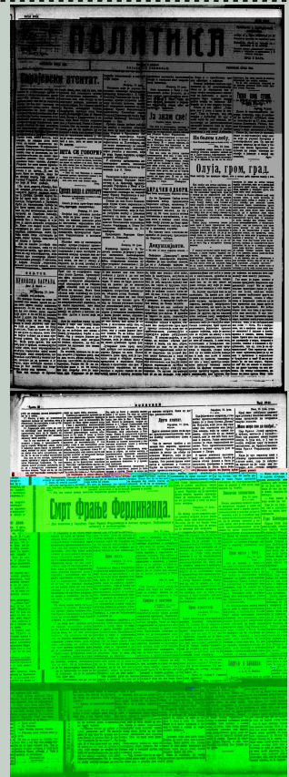
Politika, št. 3842, 6. 10. 1914, Narodna biblioteka Srbije, Online katalog

Začel se je proces proti Principu, Čabrinoviću in kolegom zaradi umora Franca Ferdinanda in njegove žene. Tožilec s sarajevskega sodišča obtožuje Principa in še dvaindvajset njegovih kolegov veleizdaje in izvedbe dveh naklepnih umorov. Razen njih pa še tri posameznike zaradi sodelovanja v prikrivanju orožja, ki je bilo nabavljeno z namenom izvedbe atentata. V obtožnici je predstavljena zarota, ki je bila skovana v Beogradu med člani Narodne odbrane, opisano je tudi potovanje zarotnikov in tihotapljenje orožja v Bosno, način, kako so zarotniki dobili sodelavce v Sarajevu, in druge podrobnosti o atentatu. V predstavitvi motivov atentata, ki je prvorazredni politični dogodek, obtožba opisuje iredentistična varovanja velikosrbskih krogov v Beogradu, ki segajo do samega dvora, in sistematično delovanje proti Avstro-Ogrski in habsburški dinastiji v Srbiji, na Hrvaškem in v Bosni. Cilj tega delovanja je odcepiti Hrvaško, Dalmacijo, Istro, Bosno, Hercegovino in dežele južne Ogrske, ki jih naseljujejo Srbi, ter to ozemlje priključiti Srbiji. Zarotnika, Princip in Čabrinović, sta priznala, kot je navedeno v enem izmed telegramov iz Sarajeva, da sta bila navdihnjena s sovraštvom proti monarhiji in velikosrbskimi idejami, ki težijo k združitvi vseh Jugoslovanov, uničenju Avstro-Ogrske in nastanku velikega srbskega cesarstva. Zato so naredili načrt atentata na Franca Ferdinanda, ki so ga tudi uresnili.