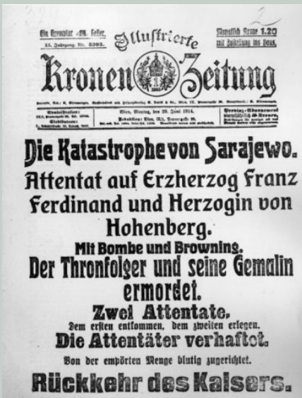
http://einestages.spiegel.de/hund-images/2009/11/16/96/e70e86700c4437f45762133de62765b5_image_document_large_featured_borderless.jpg , downloaded on 2 June 2013

»Naslednika avstrijskega prestola in soprogo umorila bosanska mladina, ki se maščuje za odvzem domovine«