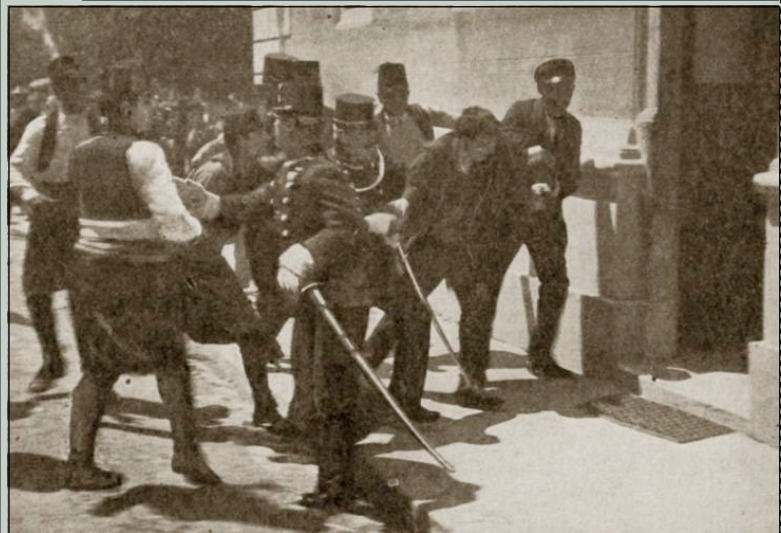
Sarajevo Museum, Sarajevo during the Austro-Hungarian Monarchy 1914-1918, Display presentation