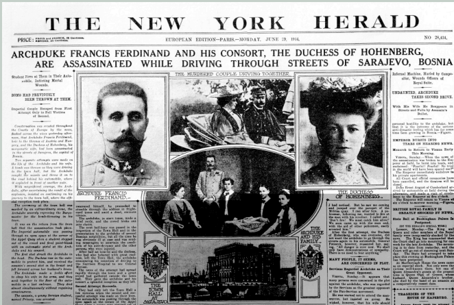
http://blog.postcardgallery.net/i/pics/nyh-06-29-1914-saravo-assassination.jpg (New York Herald, New York daily paper published in the period 1835 to 1924), downloaded on 2 June 2013

Domenica del Corriere (italijanski sedmični list)